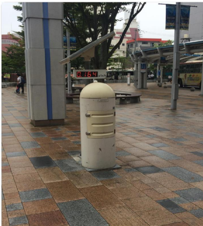
資料2：学習者 B が撮影した写真と「声」