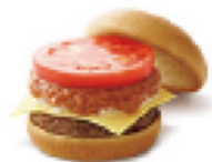
モスチーズバーガー ¥400 414kcal