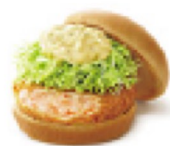
海老カツバーガー ¥390 386kcal