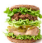
🔥 【毎月29日限定】スパイシーにくにくにくバーガー ¥880 586kcal