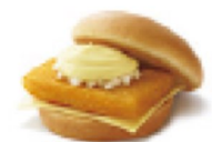
フィッシュバーガー ¥340 392kcal