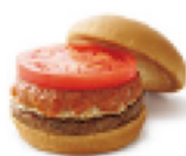
モスバーガー ¥370 361kcal