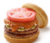
D 🔥 スパイシーダブルチーズバーガー ¥520 510kcal