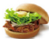
テリヤキチキンバーガー ¥360 305kcal