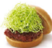
ロースカツバーガー ¥380 408kcal