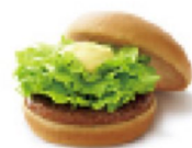
テリヤキバーガー ¥360 370kcal