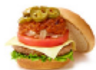
🔥 【毎週金曜日限定】スパイシーごちそうチリバーガー ¥550 429kcal