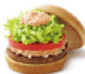
モス野菜バーガー ¥360 347kcal